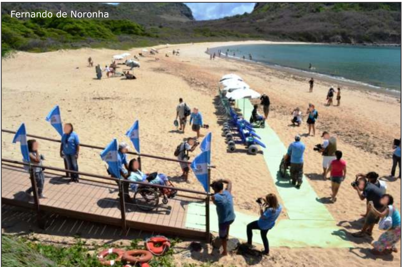
Fernando de Noronha